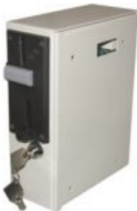
TT-Coin elektromos, érmés zár